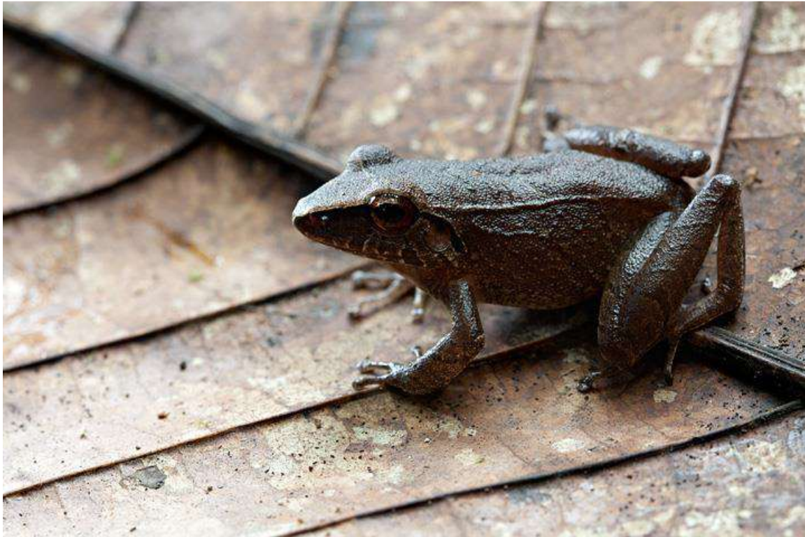
Ilustración 3. Pristimantis cóndor, anfibio representativo de San Carlos de las Minas