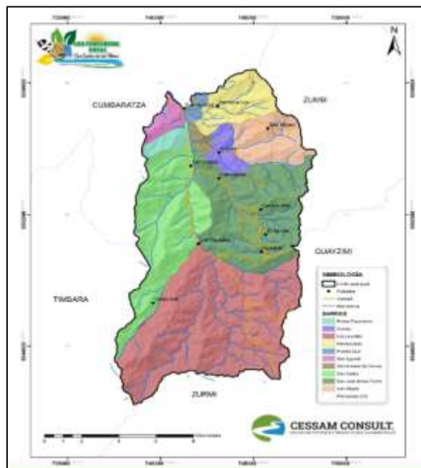
Grafico 1: División política