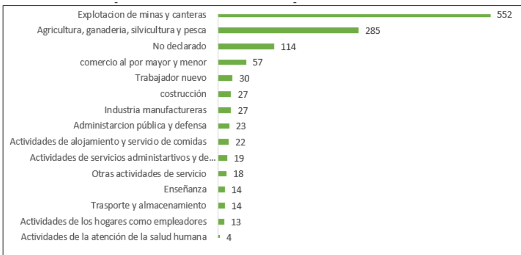
Gráfico 3: PEA por rama de actividad de la Parroquia San Carlos de las Minas.

De lo antes indicado, se puede determinar que la principal actividad entre la Población Económicamente Activa de la Parroquia San Carlos de las Minas es la Explotación de minas y canteras con un 44.83 % de la población dedicada a esta actividad que se ha convertido en la base de la economía parroquial. Sin embargo, debe considerarse que un porcentaje mayor de la población está involucrada de diversas formas en la cadena productiva minera, ya sea en calidad de trabajadores, inversionistas o como vendedores de bienes y servicios. Una segunda actividad productiva en la parroquia es la Agricultura, ganadería, silvicultura y pesca. La Actividad Comercial se encuentra en tercer lugar; esta actividad se desarrolla en la forma de pequeños almacenes y tiendas, los mismos que sirven para dinamizar la economía y que se encuentran asentados principalmente en el centro de los barrios.