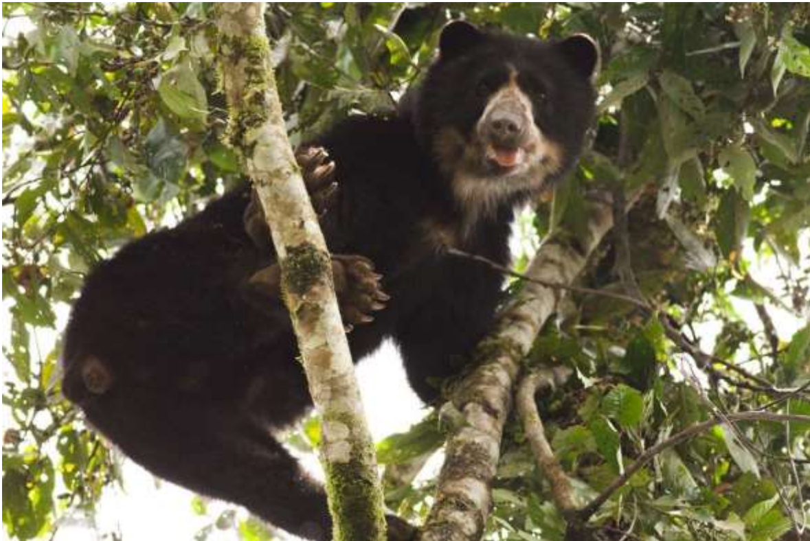
Ilustración 2. Tremarctos ornatus , mamífero representativo de San Carlos de las Minas