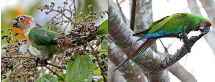
Ilustración 1. Ara militaris y Pyrrhura albipectus , especies de aves representativas de San Carlos de las Minas

áreas previamente alteradas y poco disturbadas.